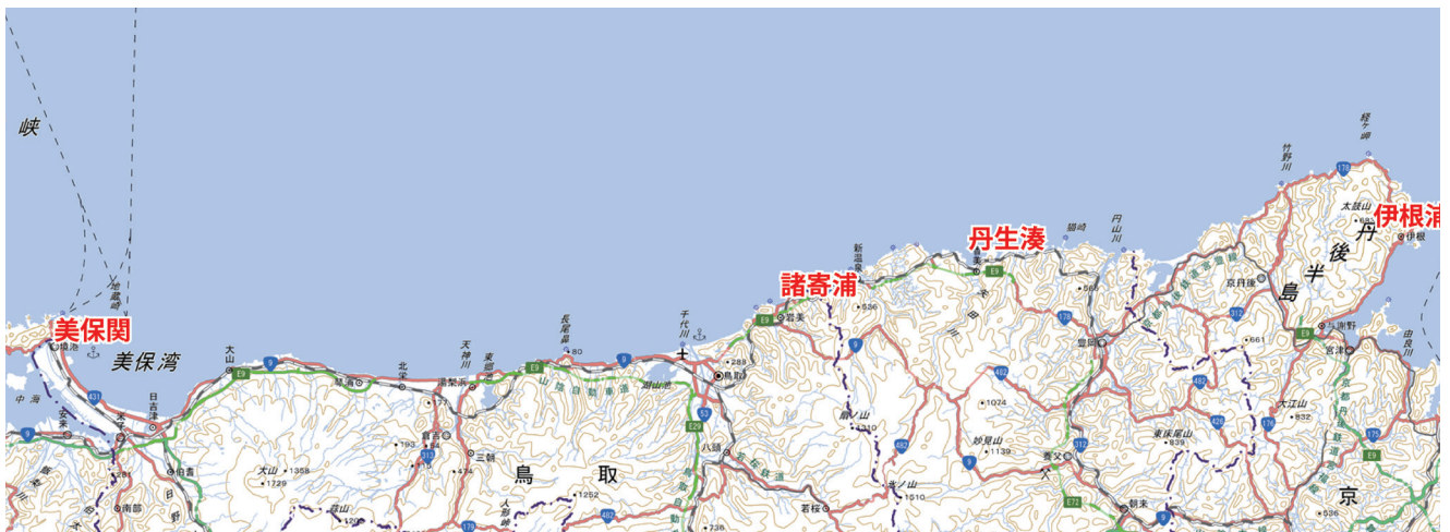
図1：諸寄浦周辺図(伊根浦～美保関) 国土地理院地図( https://maps.gsi.go.jp/ , 一部加筆)